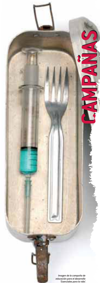
Imagen de la campaña de educación para el desarrollo "Esenciales para la vida".

LA SALUD EN EL MILENIO, UNA FIRMA PENDIENTE