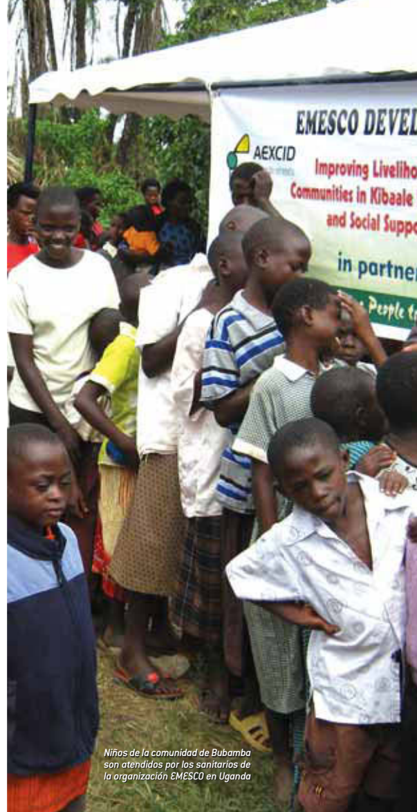
Niños de la comunidad de Bubamba son atendidos por los sanitarios de la organización EMESCO en Uganda

Farmamundi ha realizado en 2011 un total de 12 intervenciones en Sierra Leona (2), República Democrática del Congo (4), Cuerno de África, concretamente en Kenia (2), en Togo y Costa de Marfil (1), y El Salvador y Guatemala (3) y que ha beneficiado a más de 400.000 personas.