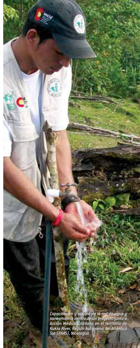
Capacitación y mejora de la red de agua y saneamiento dentro de un proyecto junto a Acción Médica Cristiana en el territorio de Kukra River, Región Autónoma del Atlántico Sur (RAAS), Nicaragua.

Más que nunca, la Educación para el Desarrollo ha de ser una herramienta fundamental para generar una concienciación y cambio social que promueva la solidaridad con los países del Sur, apostar por las alianzas estratégicas con otros actores sociales y, sobre todo, por la innovación en nuevas propuestas que desarrollen productos y servicios de calidad, socialmente útiles y económicamente sostenibles para las personas a las que sirven y las empresas que las apoyen.